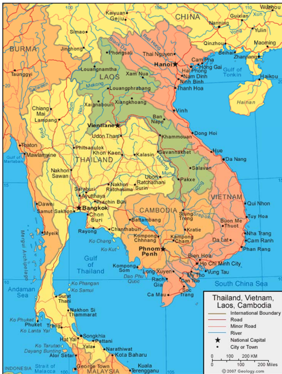
ภาพที่ 15.1 แผนที่ประเทศไทย

ประเทศไทยตั้งอยู่ในภาคพื้นทวีปเอเชียตะวันออกเฉียงใต้ (Continental Southeast Asia) เหนือบริเวณเส้นศูนย์สูตร โดยเป็นส่วนหนึ่งของคาบสมุทรอินโดจีน (ภาพที่ 15.1)