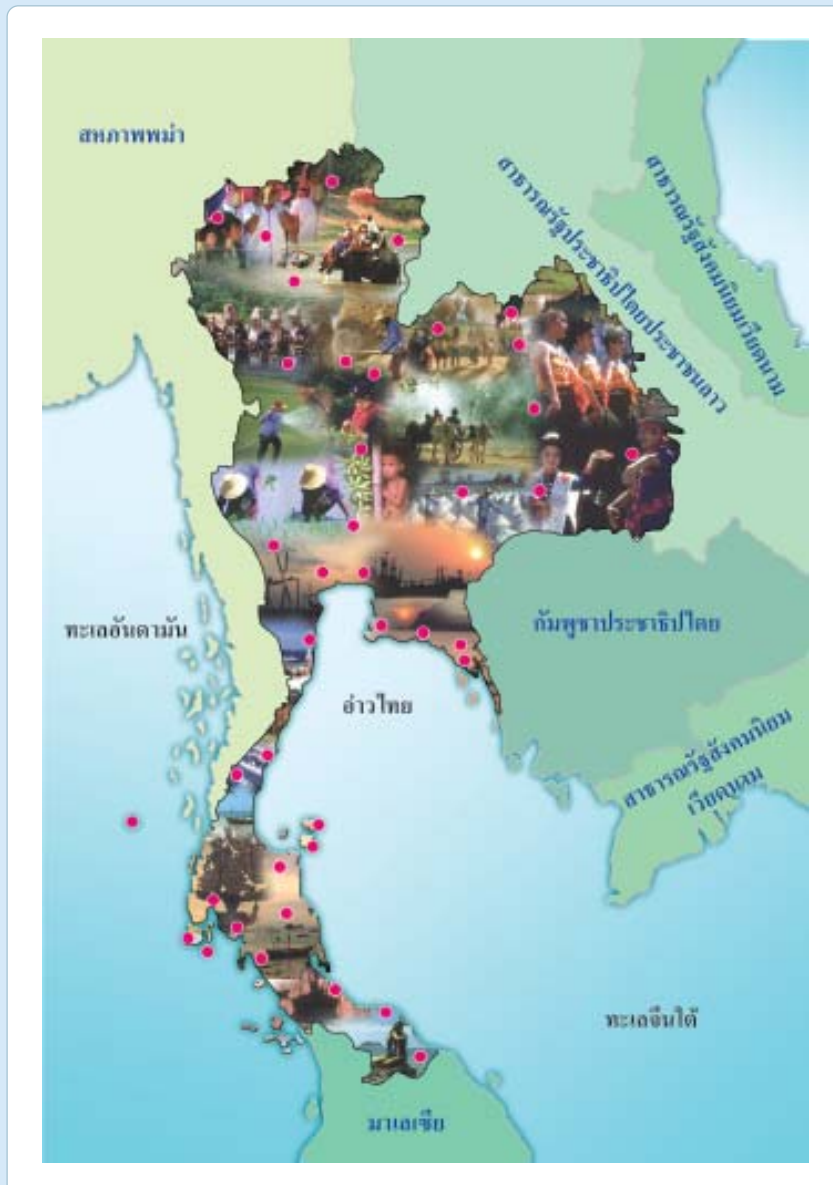
ภาพที่ 2.1 แผนที่ประเทศไทย

ประเทศไทยตั้งอยู่ในภาคพื้นทวีปเอเชียตะวันออกเฉียงใต้ (Continental Southeast Asia) เทียบบริเวณเส้นศูนย์สูตร โดยเป็นส่วนหนึ่งของคาบสมุทรอินโดจีน (ภาพที่ 2.1)