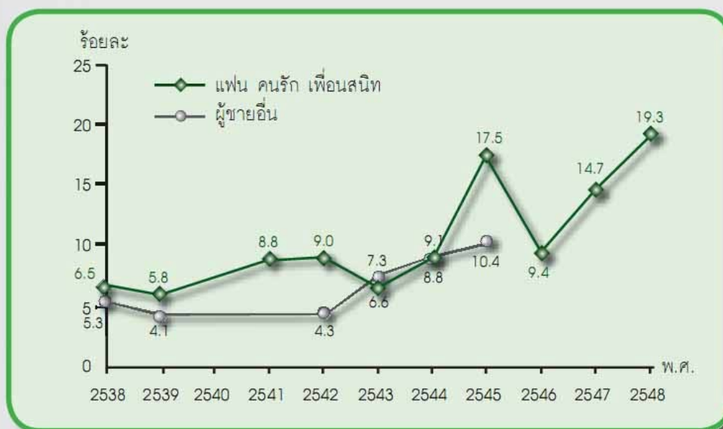
แผนภาพที่ 2 อัตราการใช้ถุงยางอนามัยทุกครั้งในการมีเพศสัมพันธ์กับคู่นอนในรอบปีที่ผ่านมาของคนงานหญิงในโรงงานอุตสาหกรรม