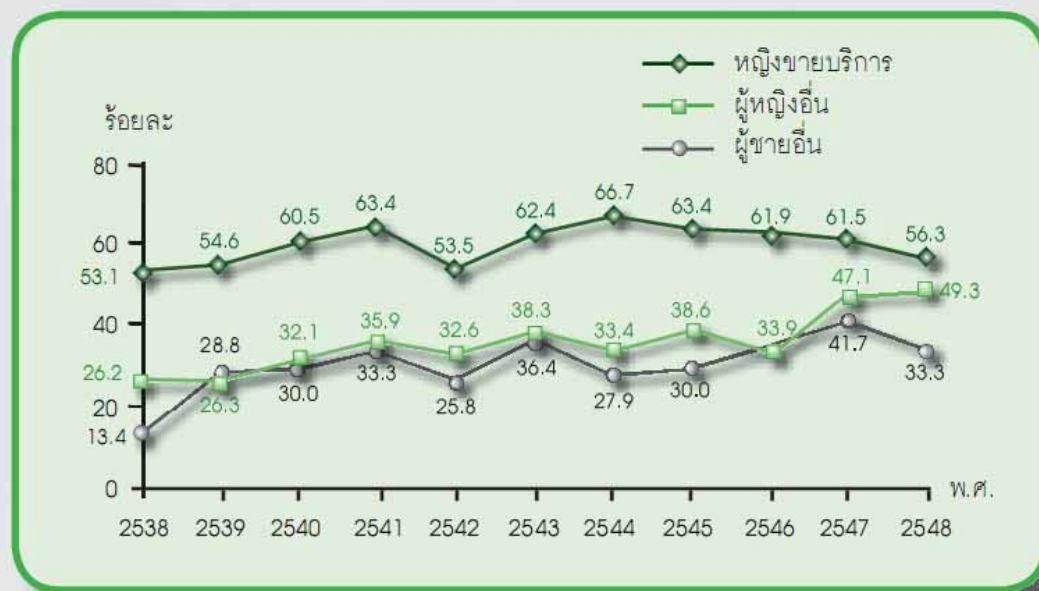
แผนภาพที่ 1 อัตราการใช้ถุงยางอนามัยทุกครั้งในการมีเพศสัมพันธ์กับคู่นอนในรอบปีที่ผ่านมาของคนงานชายในโรงงานอุตสาหกรรม