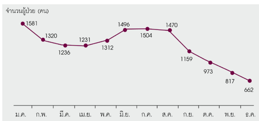
ภาพที่ 2 แนวโน้มการป่วยด้วยโรคบิดในแต่ละเดือนของปี 2553