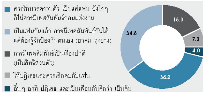
ภาพที่ 3 คำแนะนำที่จะให้เพื่อน หากทราบว่าเพื่อนถูกแฟนชักชวนให้มีเพศสัมพันธ์ด้วย