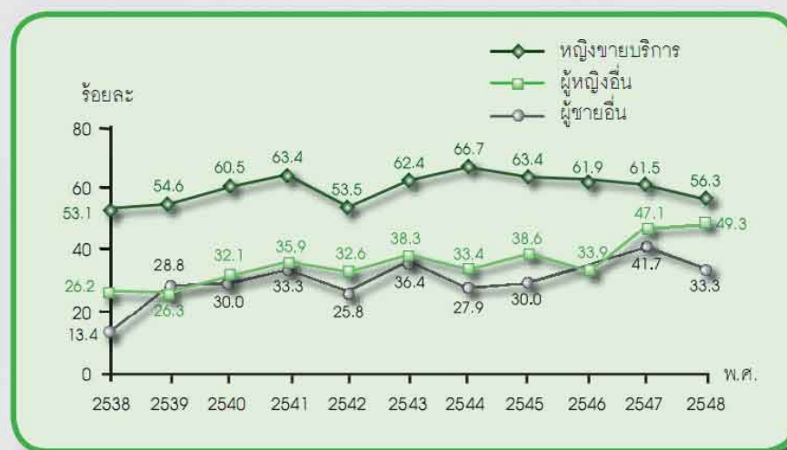
แผนภาพที่ 1 อัตราการใช้ถุงยางอนามัยทุกครั้งในการมีเพศสัมพันธ์กับคู่นอนในรอบปีที่ผ่านมาของคนงานชายในโรงงานอุตสาหกรรม