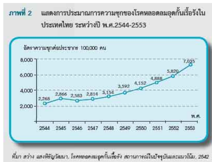
ภาพที่ 2 แสดงการประมาณการความชุกของโรคหลอดลมอุดกั้นเรื้อรังในประเทศไทย ระหว่างปี พ.ศ.2544-2553

โรคทางเดินหายใจอุดกั้นเป็นโรคที่สร้างความทุกข์ทรมานให้แก่ผู้ป่วยอย่างสาหัสสากรรจ์ไปจนถึงนาทีสุดท้ายของชีวิต ด้วยเหตุนี้จึงน่าเศร้าอย่างยิ่งที่แนวโน้มแสดงให้เห็นว่าจำนวนผู้ป่วยด้วยโรคนี้ทะยานสูงขึ้นตั้งแต่ปี 2546 เป็นต้นมา และคาดว่าในปี พ.ศ.2553 ที่จะถึงนี้จำนวนผู้ป่วยจะเพิ่มขึ้นเป็น 7,035 คน หรือมากกว่า 3 เท่าตัวในระยะเวลา 10 ปี